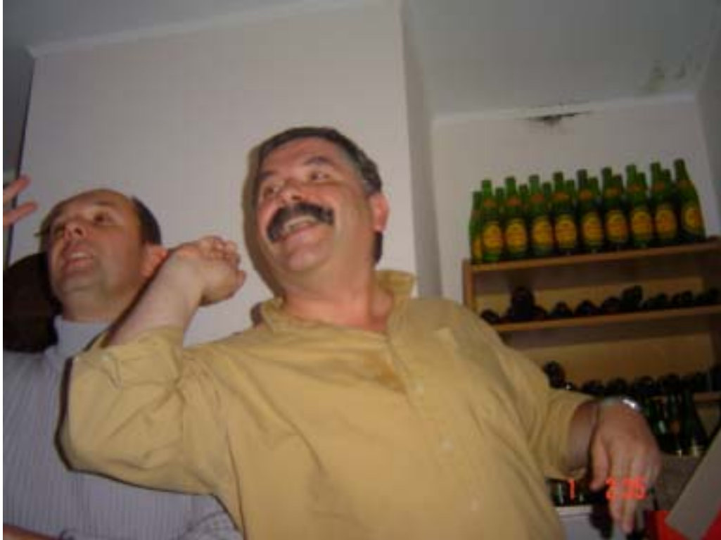
Пан Попсуймайстер танцює на КУПО в Києві