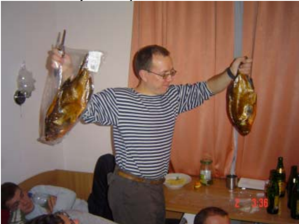
Пан Одисей каже, що Чорноморець зловив усім рибу. Здається, що риби в Україні живуть у пластиці.